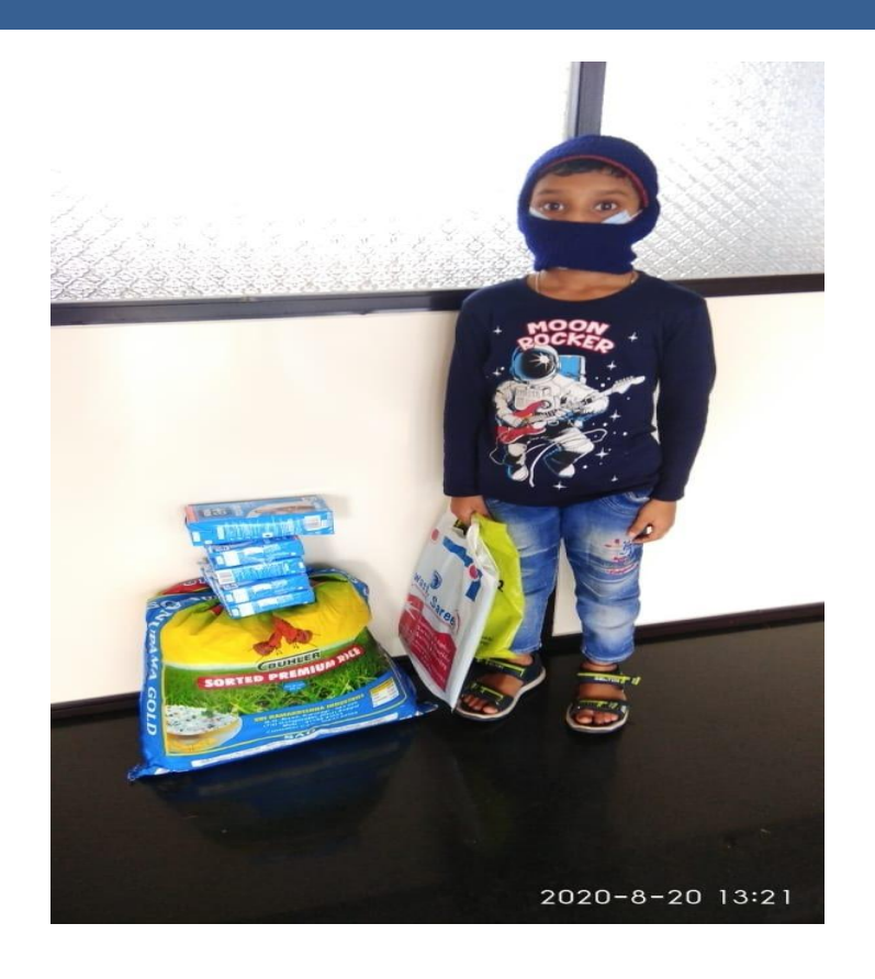
Packets distributed from July 2020 to September 2021